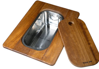
Rejilla Black 8100 652